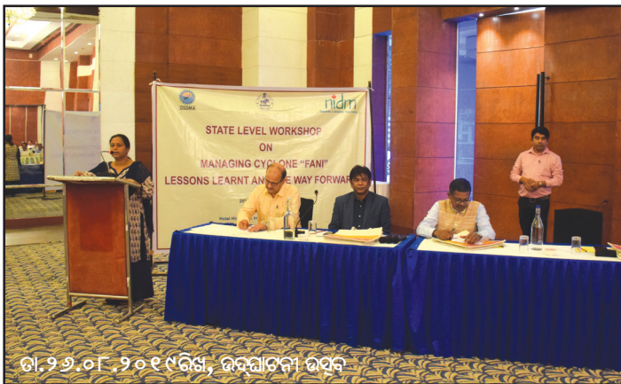
ତା.୨୬.୦୮.୨୦୧୯ରିଖ, ଉଦ୍‌ଘାଟନା ଉତ୍ସବ

କର୍ମଶାଳାର ଦ୍ୱିତୀୟ ଦିବସରେ ‘ଫନି’ ପ୍ରଭାବିତ ଜିଲ୍ଲାମାନଙ୍କର ବିଭିନ୍ନ ବିଭାଗର ଜିଲ୍ଲାସ୍ତରୀୟ ଅଧିକାରୀ, ଜିଲ୍ଲା ଜରୁରୀକାଳୀନ ଅଧିକାରୀ, ଜିଲ୍ଲା ପ୍ରକଳ୍ପ ଅଧିକାରୀ ତଥା ଓଡ୍ରାଫ୍, ଏନଡିଆର୍ଏଫ୍, ଓଡ଼ିଶା ଅଗ୍ନିଶମ ବିଭାଗ, ସିଭିଲ୍ ଡିଫେନ୍ସ, ଓଏସ୍ଡିଏମ୍ଏ ଏବଂ ଏନ୍ଆଇଡିଏମ୍‌ର ଅଧିକାରୀମାନେ ଅଂଶଗ୍ରହଣ କରିଥିଲେ।